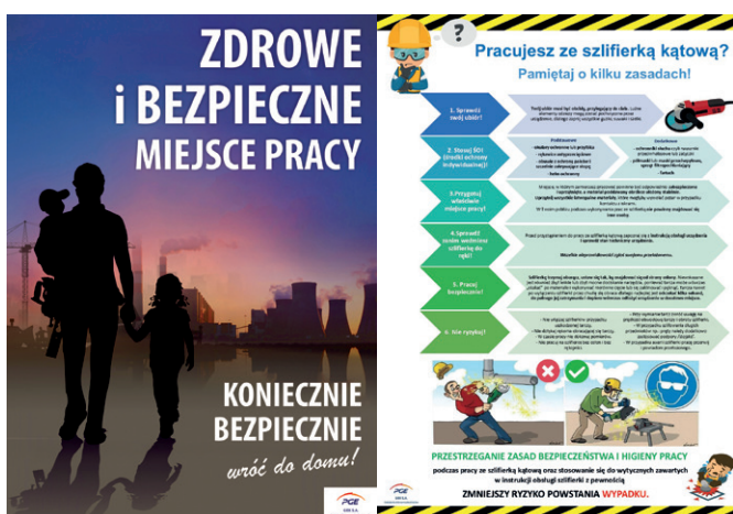
Fot. 1. Kampanie plakatowe: „Zdrowe i bezpieczne miejsce pracy” oraz „Pracujesz ze szlifierką kątową” (PGE GiEK Oddział Elektrownia Bełchatów)

Traktując bezpieczeństwo pracy jako priorytet, Elektrownia Bełchatów stale podejmuje wysiłki na rzecz budowania kultury bezpieczeństwa, zwiększania świadomości zagrożeń i kształtowania postaw opartych na trosce o współpracowników. Ważnymi działaniami w tym obszarze są kampanie informacyjno-educacyjne przygotowywane przez dział bhp Elektrowni Bełchatów (fot. 1).