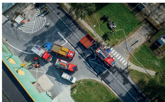
Fot. 2. Ćwiczenia przeciwpożarowe (Pilkington Polska)