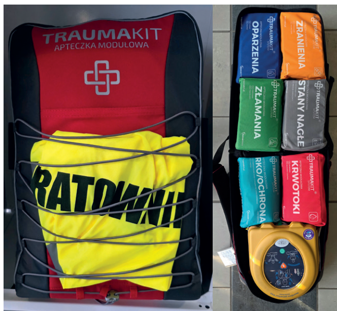
Fot. 3. Zestaw ratowniczy TraumaKit jako element systemu pierwszej pomocy (Enea Elektrownia Połaniec)

W Enea Elektrownia Połaniec szczególną wagę przywiązuje się do sprawnie funkcjonującego systemu pierwszej pomocy. Spółka wdrożyła nowoczesne rozwiązanie opierające się na pracownikach przeszkolonych z zakresu kwalifikowanej pierwszej pomocy oraz mobilnych zestawach ratowniczych TraumaKit (fot. 3). Na terenie elektrowni wyznaczono 12 punktów, w których umieszczono specjalne szafki z plecakami ratowniczymi. Każdy z nich jest wyposażony w sześć modułów – zranienia, oparzenia, stany nagłe, krwotoki, złamania oraz RKO/ochrona – i zawiera defibrylator AED. Modułowa konstrukcja plecaków umożliwia ratownikom szybkie i skuteczne działanie w sytuacjach zagrożenia życia, a przenośna forma zestawu zapewnia komfort przemieszczania się do miejsca zdarzenia. Za koordynację działań ratunkowych odpowiada dyżurny inżynier ruchu, który na początku każdej zmiany zbiera informacje o obecności ratowników, co pozwala na skierowanie do zdarzenia najbliższej znajdującej się osoby przeszkolonej. Ratownicy po otrzymaniu