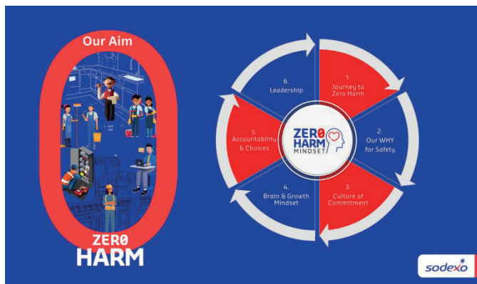
Fot. 7. Program szkoleniowy „Zero Harm Mindset” (Sodexo Polska)

Firma wdrożyła całodobową infolinię pomocową, dostępną siedem dni w tygodniu, gdzie pracownicy mogą uzyskać wsparcie psychologiczne, prawne lub finansowe – szybko, anonimowo i bez barier. W 2024 r. wprowadzono dodatkowy pełnopłatny dzień wolny na dowolne badania profilaktyczne (poza obowiązkową medycyną pracy), by zachęcić do regularnego sprawdzania stanu zdrowia.