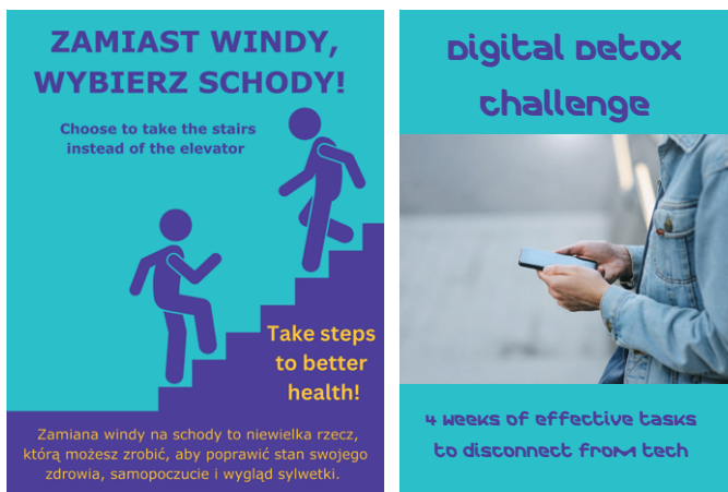
Fot. 4. Działania promujące aktywność fizyczną i zdrowie psychiczne pracowników (Merck Business Solution Europe)

są m.in. praca zdalna i program wsparcia pracowników (ang. employee assistance program – EAP), zapewniający kompleksową pomoc psychologiczną oraz dostęp do webinarów dotyczących zdrowia psychicznego. Ponadto pracownicy mogą korzystać z pomocy specjalistów oraz brać udział w warsztatach mindfulness, sesjach jogi, ćwiczeniach body scan , relaksujących spotkaniach z użyciem mis i gongów himalajskich czy warsztatach oddechowych. W firmie nie brakuje też takich inicjatyw, jak Cyfrowy Detoks, zachęcających do ograniczenia czasu spędzanego przed ekranem w celu przywrócenia równowagi między życiem online i offline. W przestrzeni biurowej dostępne są natomiast proste narzędzia relaksacyjne, np. kolorowanki dla dorosłych, które sprzyjają odprężeniu i redukcji stresu.