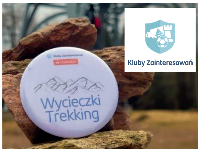
Fot. 5. Logo Klubów Zainteresowań oraz Klubu Wycieczki i Trekkingu (Santander Bank Polska)

Powstały one w 2022 r. w ramach jednego z czterech filarów strategii na rzecz dobrostanu pracownika – „Udane relacje”. Idea była prosta: dajmy ludziom przestrzeń do dzielenia się pasjami. Tak narodziła się inicjatywa w pełni zależna od pracowników – klub powstaje tylko wtedy, gdy znajdzie się osoba gotowa pełnić rolę jego koordynatora. Każdy pracownik może dołączyć do istniejącego klubu lub stworzyć własny, o dowolnej tematyce – ważne, by mieściła się w idei zdrowia i rozwoju. W efekcie powstały kluby sportowe (klub piłki nożnej, siatkówki, rolkowy), pasjonackie (klub czytelniczy, gotowania, rękodzieła), technologiczne (np. klub sztucznej inteligencji), a nawet finansowe (klub inwestowania). Co istotne, kluby działają zarówno stacjonarnie, np. we Wrocławiu czy w Warszawie, jak i online, są więc dostępne dla pracowników z całej Polski. Każdy klub